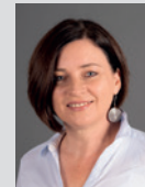
Eva Konzett Kommunikation / Verwaltung